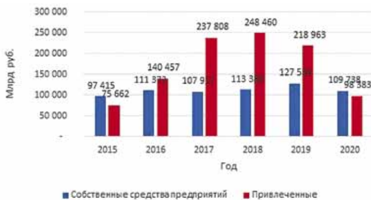
Рис. 1. Динамика инвестиций в основной капитал в Республике Саха (Якутия), млрд руб.

При этом компания «Колмар» не допускает при производстве угля экологических нарушений, использует единый цикл добычи, обогащения и отгрузки высококачественного коксующегося и энергетического угля, добываемого на месторождениях Нерюнгринского района [10]. Также при производстве угля компанией «Колмар» создаются защитные опыления специально приобретенными и установленными дорогостоящими во-