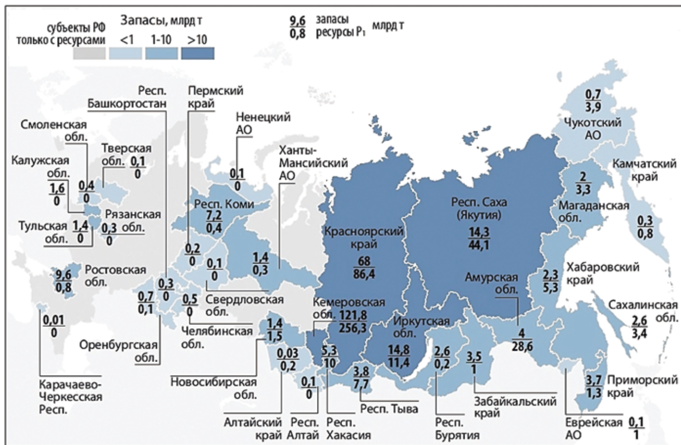
Рис. 1. Распределение запасов угля (кат. А+В+С 1 +С 2 ) и его прогнозных ресурсов (кат. Р 1 ) между субъектами Российской Федерации, млрд т