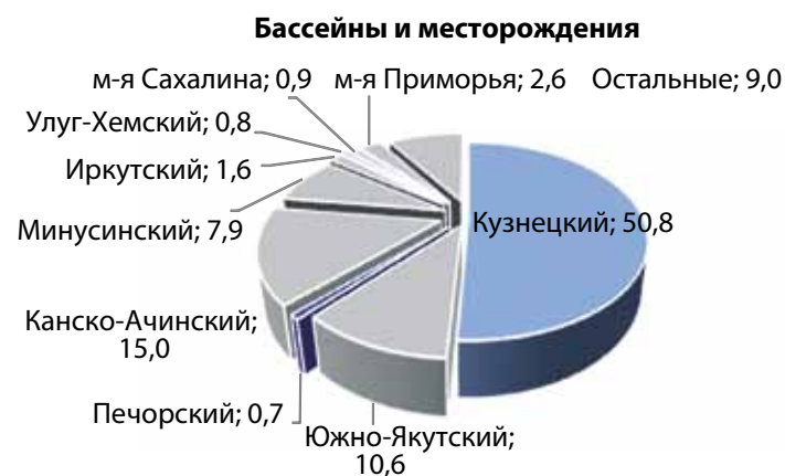
Рис. 2. Распределение балансовых запасов угля (кат. А+В+С 1 ) на действующих предприятиях по основным угольным бассейнам России, %

В соответствии с прогнозами ПРУП-2035 предусматриваются следующие объемы развития добычи угля на перспективных месторождениях в новых центрах угледобычи на востоке страны (см. рис. 3, 4):