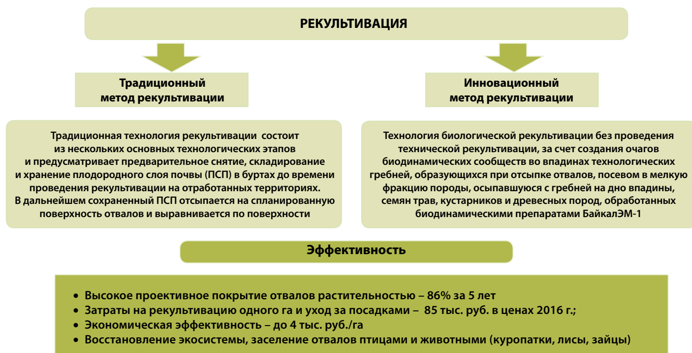
Рис. 1. Традиционные и инновационные мероприятия для снижения негативного влияния на окружающую среду деятельности разреза «Черногорский»

Для решения этих задач ООО «СУЭК-Хакасия» сотрудничает с Федеральным государственным бюджетным науч-