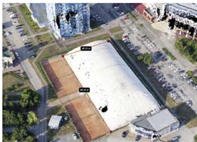
Рис. 2. Пример трехмерной точечной модели здания