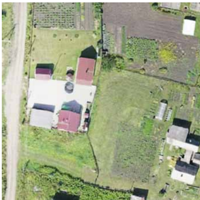
Рис. 3. Пример RGB-снимка из ортофотоплана, подготовленного для работы нейронной сети Fig. 3. An example of an RGB-image from the orthophotomap, prepared for the neural network

На следующем этапе исследования проводятся уточнение и корректировка характеристик всех объектов недвижимости. Для этого с помощью искусственного интеллекта определяются координаты центроида, соответствующего очертаниям здания. Затем проводится приведение к единому стандартному виду адресов зданий. Далее все существующие базы данных (Единый государственный реестр недвижимости, Федеральная информационная адресная система, данные Бюро технической инвентаризации, автоматизированная информационная систе-