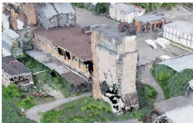
Рис. 6. Пример обнаружения незарегистрированной постройки на земельном участке с установленными границами