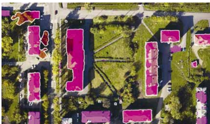
Рис. 5. Пример обнаружения зданий и сооружений на ортофотоплане нейронной сетью «U-net» Fig. 5. An example of detecting buildings and structures on an orthophotomap by the U-net neural network