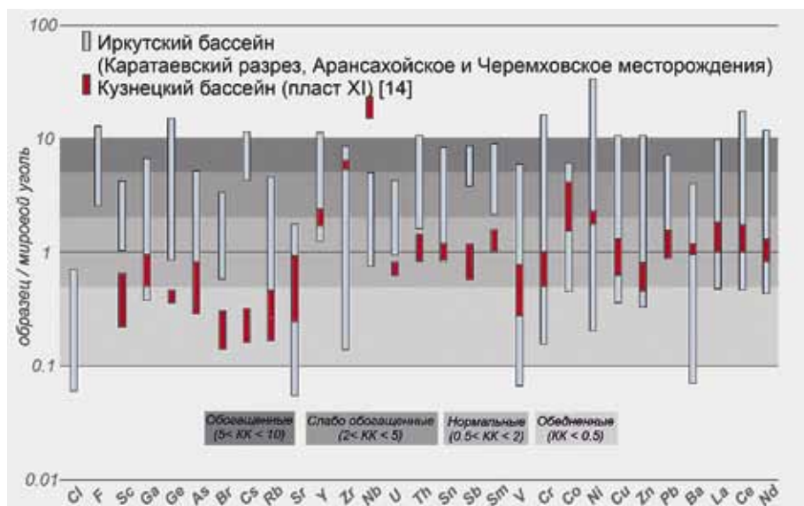
Рис. 2 Нормированный к мировому углю [9] график распределения концентраций элементов углей Иркутского бассейна Распадского разреза Кузнецкого бассейна [по данным 14]. Коэффициенты концентрации (КК) микроэлементов (по [10]) в углях по сравнению с мировым углем

Fig. 1. A distribution plot of the coal element concentrations normalized to the world coal [9] in the Irkutsk basin and coal samples from the dump and coal concentrate of the Kasyanovskaya coal preparation plant. Coefficients of trace element concentrations (by [10]) in coals as compared to the world coals