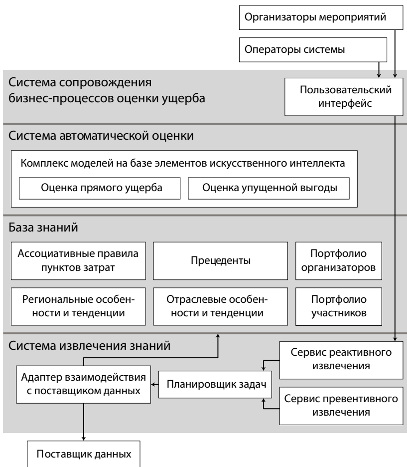
Рис. 3. Функциональная архитектура системы сопровождения бизнес-процессов оценки экономического ущерба