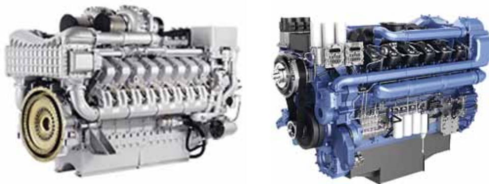
Рис. 2. ДВС: а – MTU 16V4000; б – WEICHAИ 12M55