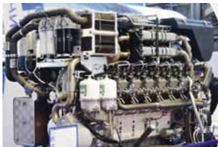
Рис. 3. ДВС: а – 12ДМ-185; б – 16-36ДГ; в – М-150 (пульсар)