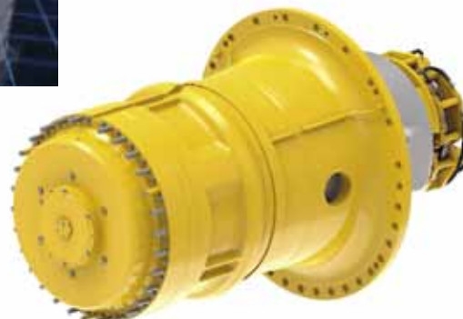
Рис. 5. Редуктор мотор-колес