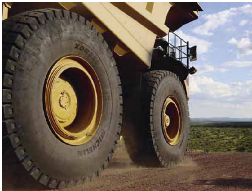
Рис. 6. Колеса карьерного самосвала

В России отсутствует производство таких шин, а из дружественных стран шины имеют малую ходимость [18, 19]. Например, шины производства ОАО «Белшина» не отхаживают своего заявленного ресурса по ходимости, а китайские компании в последнее время повысили ходимость шин, однако они не достигают уровня таких производителей, как Bridgestone или Michelin.